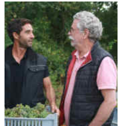
Bourgueil Mi-Pente 2020 Domaine de la Butte