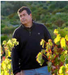
Côtes du Roussillon Modeste 2022 Domaine du Clos des Fées