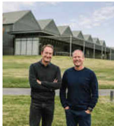
Shaw and Smith M3 Chardonnay 2021 Shaw and Smith